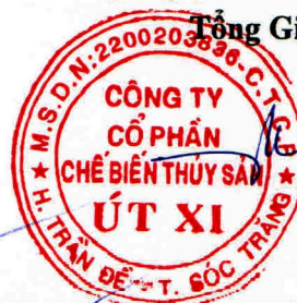
Lý Bích Quyên